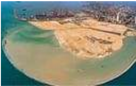
இலங்கையில் சீனாவின் தீவு... எய்யுச் சமாளிக்கப் போகிறது இந்தியா?

ஒரு கிலோ உளுந்து இந்திய மதிப்பில் 400 ரூபாய்க்கு விற்பனையாகிறது. அந்த விலைக்கு விற்காலும் கடும்தட்டுப்பாடு நிலவுகிறது. சிறுதானியங்கள், அரிசி அனைத்திற்கும் கடுமையான தட்டுப்பாடு நிலவுகிறது. அதன் காரணமாக விலையும் அதிகரித்துக் கொண்டே போகிறது. 100 கிராம் மஞ்சள் இந்திய மதிப்பில் 300 ரூபாய்க்கு விற்பனையாகிறது.